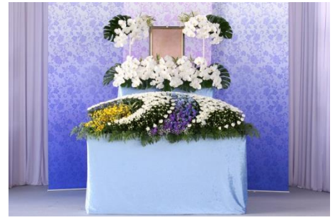
花祭壇 B タイプの場合